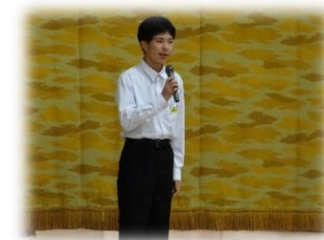
令和7年後期 生徒会長

小学生のみなさん、こんにちは！ 久米中学校は、愛媛県一の生徒数を誇る伝統ある学校です。その人数の多さを生かし、勉強だけでなく、部活動や学校行事が活発で、何事にも一生懸命取り組んでいます。きっと普段の何気ない日常がみなさんの最高の思い出になります。一緒に充実した中学校生活を送っていきましょう！