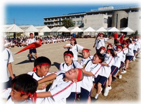
10月 熱く燃える 体育大会