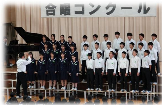
11月 歌声響く 合唱コンクール