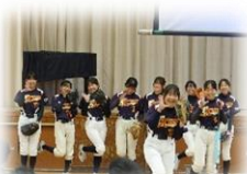
部活動オリエンテーション