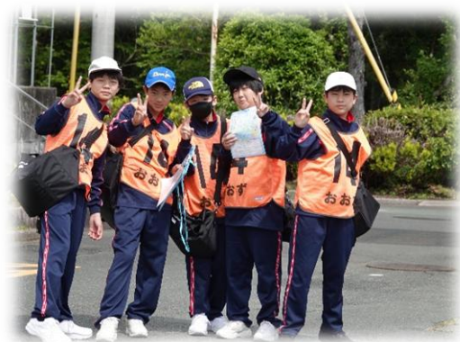
5月 1年生 大洲集団宿泊研修