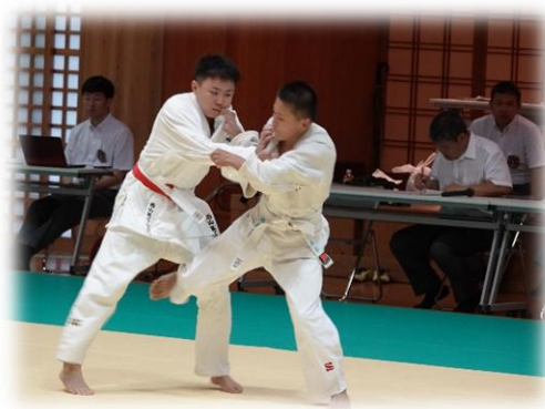
6月市総体～7月県総体～8月四国・全国総体